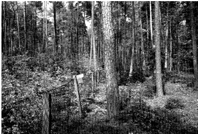
Abb.2: In der Übergangsphase müssen zum Schutz der Verjüngung vor Verbiß durch das Schalenwild Zäune gebaut werden.

Dem Problem des Wildverbisses wird durch Reduzierung der Wilddichte begegnet, denn eine Umzäunung der entsprechenden Gebiete soll nur als Übergangsphase dem Schutz dienen.