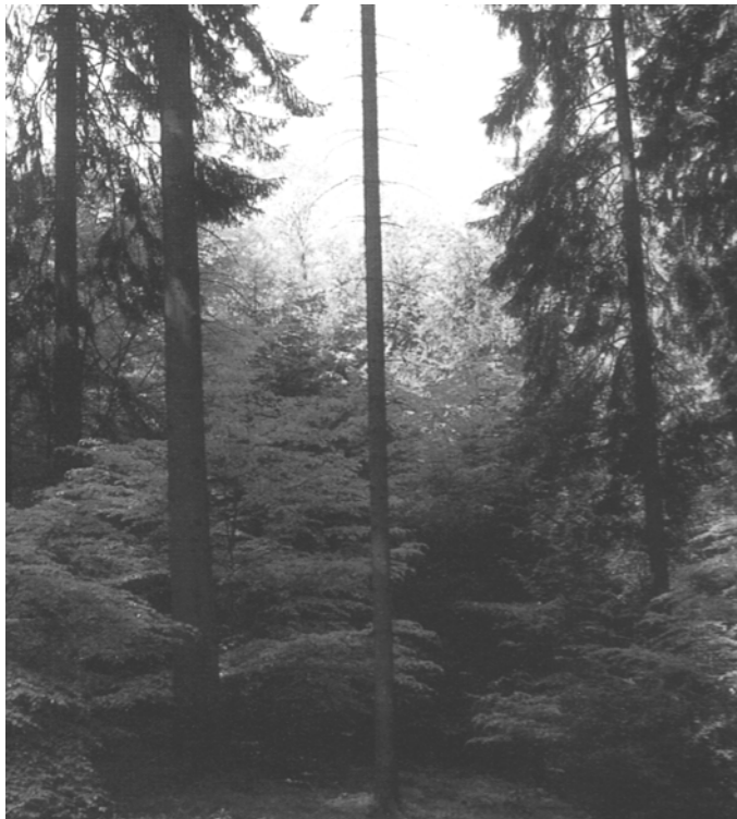
Abb.4: Fichtenbestand mit Buchenvoranbau bzw. Unterbau

Das „Gesamtkonzept für eine ökologische Waldbewirtschaftung des Staatswaldes in Nordrhein-Westfalen“ (Wald 2000) strebt eine Erhöhung des Laubwaldanteiles insbesondere durch Baumartenwechsel zu Lasten von u.a. Fichte an. Ein Laubbaumanteil stellt in der Regel eine stabilisierende und bodenpflegerische Wirkung sicher und ermöglicht langfristige Naturverjüngung. „In instabilen Beständen ist der Übergang zu reicherer Strukturierung erst in der Folgegeneration nach Sicherung der eingebrachten Mischbaumarten -häufig Buche- in stufigen Aufbauformen und in den dann stabilisierten Beständen möglich“ (KALKKUHL & SCHMIDT 1997).