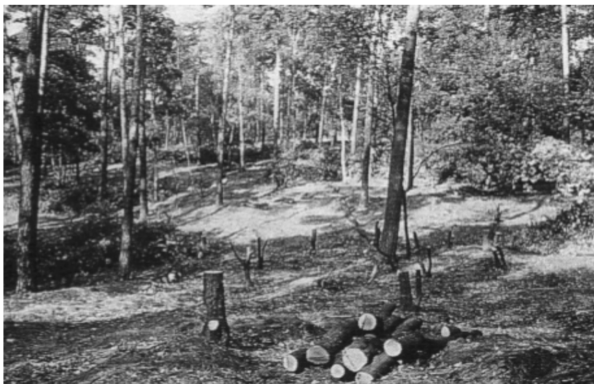
Abb. 1: Entnahme eines Douglasienbestandes und von spätblühender Traubenkirsche in einer vermoorten Senke im Grunewald

Laut Forstlicher Rahmenplanung für Berlin-West, sind die wesentlichen Ziele der forstlichen Maßnahmen die Erhöhung des Laubholzanteils von 40 auf 60 % und der Aufbau eines reich strukturierten Mischwaldes durch den vorsichtigen Umbau der aus den Nachkriegsaufforstungen hervorgegangenen Kiefernreinbestände.